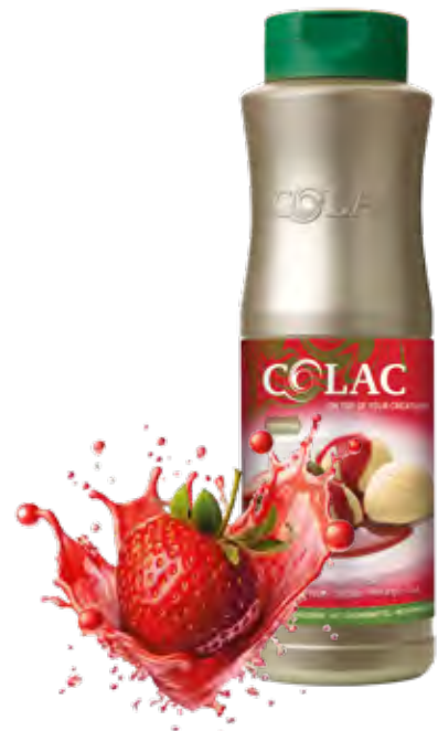
FRESA 1KG (6X1KG) 55-29082