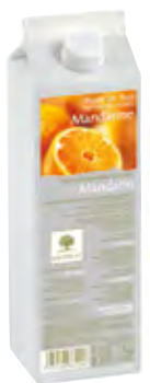
MANDARINA 1Kg (6 × 1Kg) 50-08661