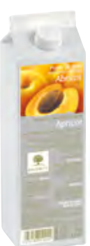
ALBARICOQUE 1Kg (6 × 1Kg) 50-08010