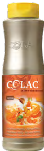
ALBARICOQUE - MIEL 55-20611