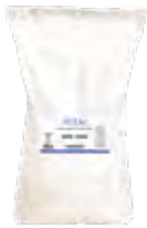
BOLSA DE PAPEL