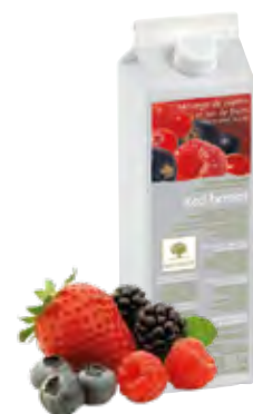
FRUTOS ROJOS Frambuesa, grosella, grosella negra, arándano rojo 1Kg (6 × 1Kg) - 50-08855