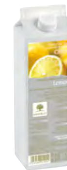
LIMÓN 1Kg (6 × 1Kg) 50-08014