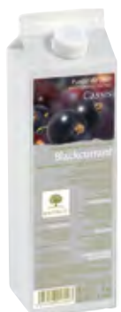
GROSELLA NEGRA (Cassis) 1Kg (6 × 1Kg) 50-08013