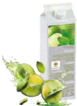
MOJITO Lima y menta 1Kg (6 × 1Kg) 50-08856

¡Los pures de fruta te proporcionarán un sabor mucho mas rico y delicioso!