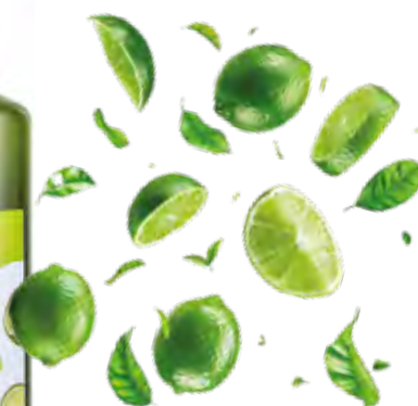
ZUMO DE LIMA 0,75 L (6 × 0,75 L) 37-50100