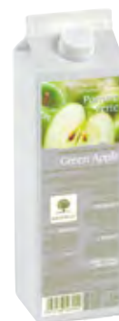
MANZANA 1Kg (6 × 1Kg) 50-08593