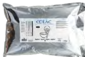
AR YOGUR 40 Presentación: 1 kg Duración: 24 meses Dosificación (G/L): 40 55-100243