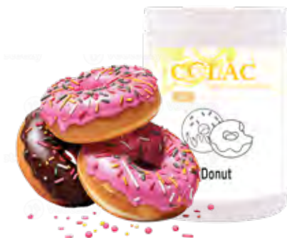
DONUT 1,15 kg (6 × 1,15 kg) 55-30131