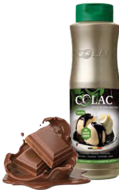
CHOCOLATE 1KG (6X1KG) 55-29070