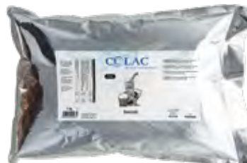
VANISTIB (CON VAINILLA MOLIDA) Presentación: 1 kg Duración: 24 Dosificación (G/L): 5-15 55-10028