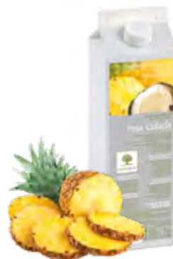
PIÑA COLADA Piña- coco 1Kg (6 × 1Kg) 50-08816