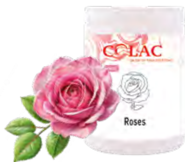
ROSAS 1,15 kg (6 × 1,15 kg) 55-30116