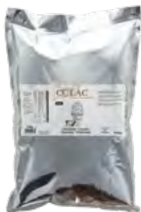
PREMEZCLA DE CHOCOLATE NEGRO Presentación: 2 kg Duración: 24 meses Dosificación (G/L): 100 55-0010201