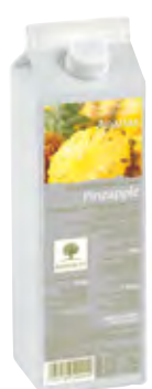
PIÑA 1Kg (6 × 1Kg) 50-08590