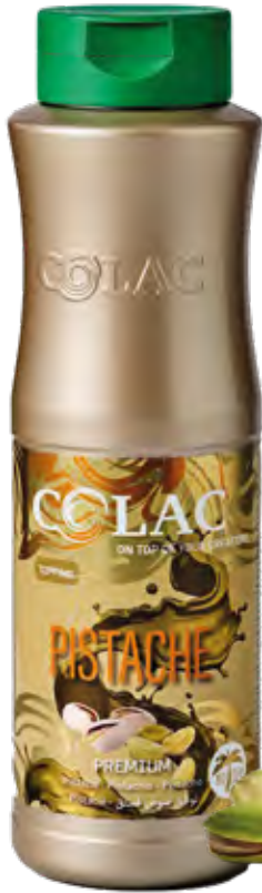
PISTACHO PREMIUM 55-20950