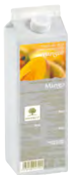
MANGO 1Kg (6 × 1Kg) 50-08017