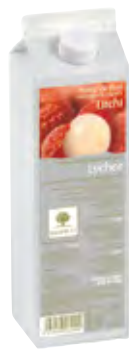
LITCHI 1Kg (6 × 1Kg) 50-08532