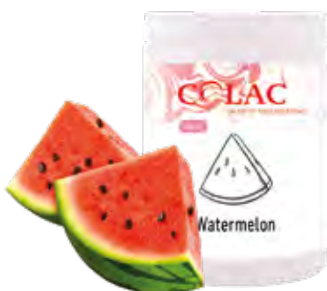
SANDIA 1,15 kg (6 × 1,15 kg) 55-30117