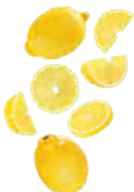
ZUMO DE LIMÓN 0,75 L (6 × 0,75 L) 37-50098

¡El punto cítrico para tus recetas más fresh!