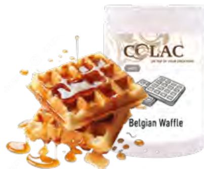
GOFRE BELGA 1,15 kg (6 × 1,15 kg) 55-30085