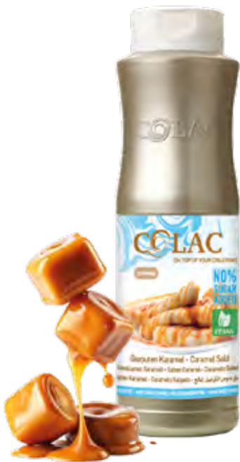
CARAMELO 1KG (6X1KG) 55-29121