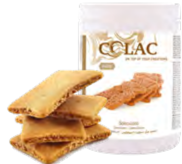
ESPECULOS BELGA 1,15 kg (6 × 1,15 kg) 55-30020