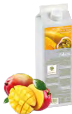
PABANA Maracuyá, mango, plátano, limón 1Kg (6 × 1Kg) 50-08817