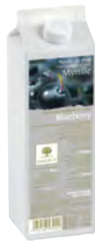
ARÁNDANO 1Kg (6 × 1Kg) 50-08564