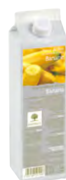
PLÁTANO 1Kg (6 × 1Kg) 50-08591