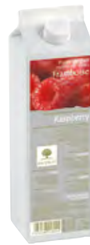
FRAMBUESA 1Kg (6 × 1Kg) 50-08016