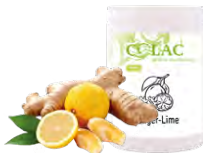
JENGIBRE Y LIMA 1,15 kg (6 × 1,15 kg) 55-30132