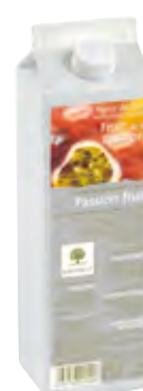
MARACUYÁ 1Kg (6 × 1Kg) 50-08018