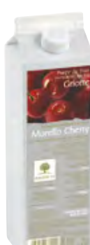
CEREZA MORELLO 1Kg (6 × 1Kg) 50-08660