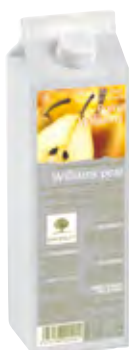
PERA 1Kg (6 × 1Kg) 50-08020