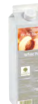
MELOCOTÓN BLANCO 1Kg (6 × 1Kg) 50-08019