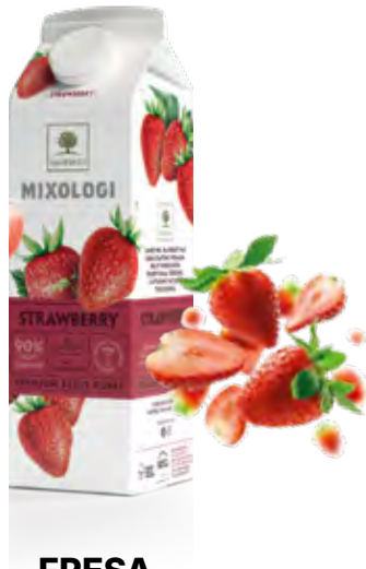
FRESA 1Kg (6 × 1Kg) 50-08015